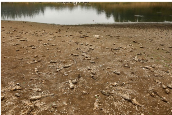
15 DE MARZO DEL 2022 SEQUÍA EN RESERVA NACIONAL LAGO PEÑUELAS.

"Frente a la transformación climática, lo que realmente está pendiente son las medidas coordinadas público-privadas para la gestión del recurso hídrico, con un enfoque de muy largo plazo, porque lamentablemente este problema llegó para quedarse".