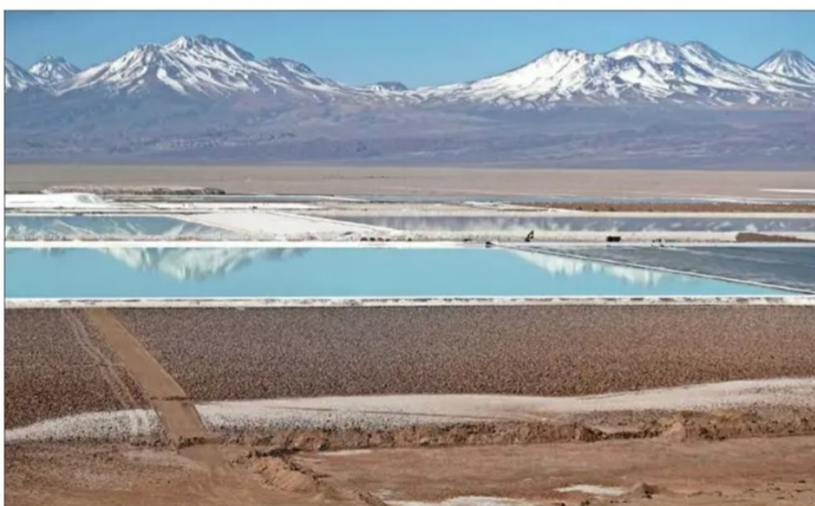
Cuatro firmas mineras han sido sancionadas por la SMA por distintas afectaciones en el Salar de Atacama.

Es por esto que apunta a que el rol de la SMA es clave, más aún considerando que el papel que juegan metales como el litio y el cobre en la transición energética global, y la importancia de que estos insumos tengan una huella