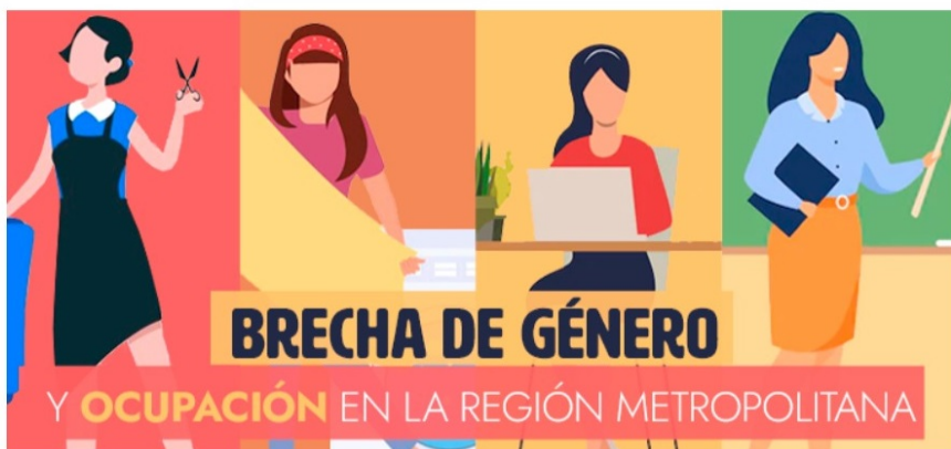
Participación laboral de las mujeres en la RM durante los últimos 10 años

08 de Marzo de 2022 | 21:20 | Por Equipo Multimedia, Emol.