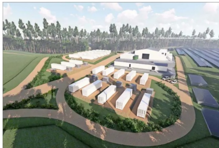
La compañía europea acaba de cerrar el financiamiento de un proyecto similar al que buscan desarrollar en Chile, en la Guayana Francesa, iniciativa que considera un sistema de almacenamiento de energía renovable.

La particularidad de la iniciativa es que es la primera en convertir el hidrógeno en electricidad. Esto se realiza a través de un sistema desarrollado por HDF con componentes que existen hace años —como un parque solar o eólico, electrolizador, almacenamiento—, pero la innovación está en que todos los componentes funcionen, sean pilotables, y que se adapten a la red.