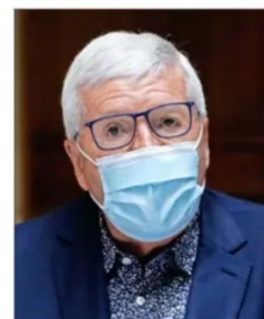
Diputado Rodrigo González (PPD).