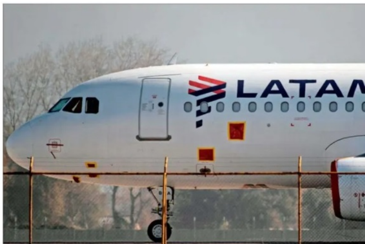
Latam solicit3 al juez James Garrity extender el perÃodo para presentar el plan de reorganizaci3n hasta el 22 de marzo de 2021.

De acuerdo con un documento ingresado el 18 de septiembre al expediente del caso, la empresa solicit3 a la corte establecer como fecha lÃmite para verificar las acreencias sin garantÃa el 18 de diciembre.